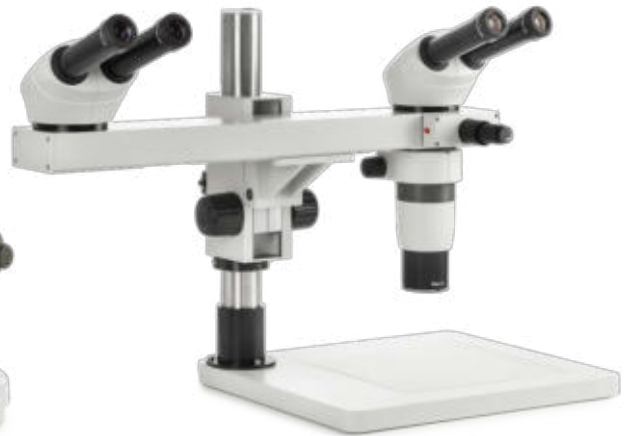
● Kundenspezifische Fluoreszenz Konfigurationsmodell