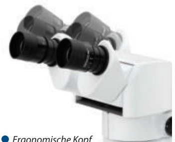
• Ergonomische Kopf