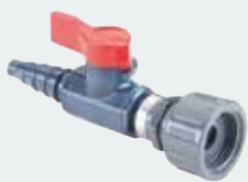
1. Reinwasser- Entnahmehahn