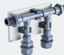
4. Reinwasser- Verteilerblock