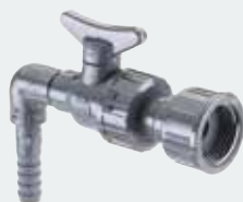
2. Reinwasser- Entnahmehahn