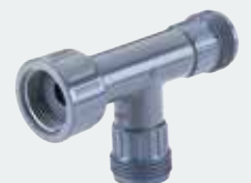
5. Reinwasser- Verteilerstück