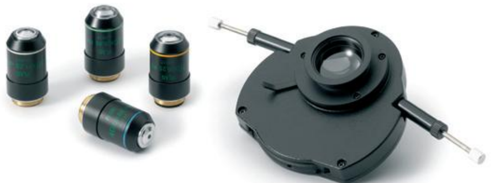
Zernike Kondensator mit Infinity Plan Achromatische Phase Objektiven

Heutzutage bietet die Fluoreszenzmikroskopie eine schnellere und zuverlässigere Identifikation infektiöser Krankheiten und ermöglicht die Beobachtung komplexer Wechselwirkungen in lebenden Zellen. Die Hochkontrast Plan Semi-Apochromatischen Fluarex 4x, 10x, 20x, S40x und S100x Öl Objektive des Oxion bieten in Kombination mit den 22 mm Okularen die notwendige Auflösung und Sichtfeld für die schnelle Detektion kleiner Erreger. Die 100 Watt Quecksilberdampf-Lampe in Kombination mit den Hochleistungs-Fluoreszenzfiltern ergeben ausgezeichnete, kontrastreiche Bilder mit einem überragenden Signal-Rausch-Verhältnis.