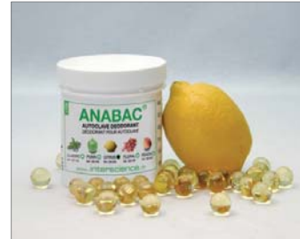
Citrus Frischer Duft Zitrone