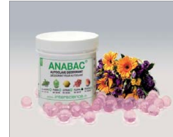
Floral Blütenduft Blumen