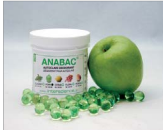
Poma Fruchtiger Duft Apfel