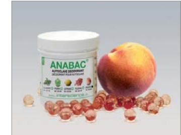
Peach Süßer Duft Pfirsich