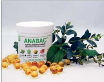
Classic Starker Duft Pfefferminz und Eukalyptus

Uk cf`X'Uh @Uk cf`X'Uh bXi gfh]Yghf UggY%Z*, ()`<c\ YbYa gZ5 i gh]U HY"Z('') +* +* +$) " : U Z(' ') +* +* +$) + 9a Uj .`cZVW4 `Uk cf`X'Uh