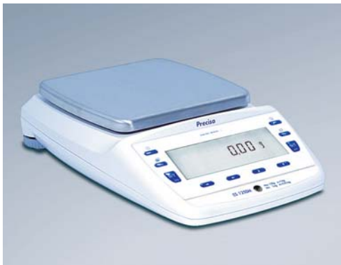
Elegante kompakte Bauform