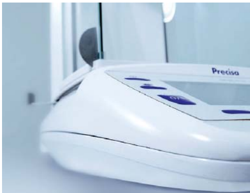
Modernes Design mit fließenden Linien