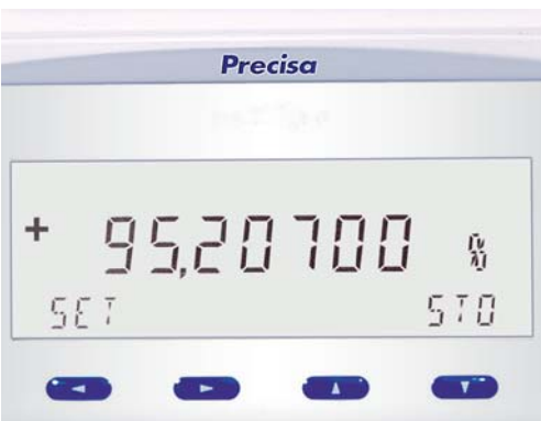
Gut ablesbare Anzeige