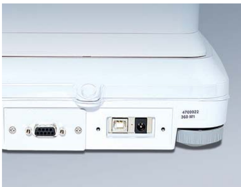
Zukunftsorientierte, vielseitige Kommunikationsanschlüsse