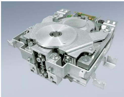
Schweizer Präzision als Herzstück der Waage