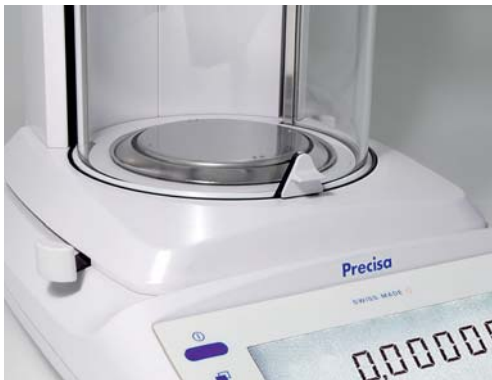
Runder, beiseitig bedienbarer Windschutz